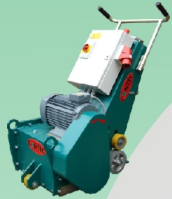
Alternativ Straßenfräse - CT 320 zum Abtrag von Asphalt